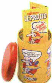
Sopra, da sin., preparato per torta La mia mattonella (San Martino, € 2,99); confezione di latta di zafferano (Zafferano Leprotto, circa € 11,00); un piatto in porcellana unico e irregolare perché fatto a mano (&Klevering, € 14,95); caraffa per 5 birre medie (Tescoma, € 19,90).