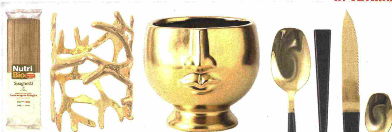
Sopra, da sin., pasta integrale ricca di principi nutritivi (Nutribio, € 0,50); un prezioso portatovagliolo a forma di corallo in zinco (KASANOVA, € 4,50); il vaso d'oro con viso è l'oggetto di design che renderà la casa più personale e chic (Vasorea, € 40,46).